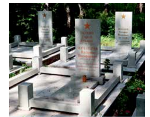
Русско-Амурский мемориальный комплекс находится возле Лисихинского парка — это часть военной истории города. В годы Великой Отечественной войны здесь хоронили солдат и офицеров, умерших в госпиталях Иркутска, — более 600 воинов нашли здесь вечный покой. Приводить в порядок мемориал начали еще в 2020 году. Это место — символ памяти иркутян и глубокой благодарности всем защитникам Отечества

В столице Прибайкалья восстановили могилы солдат, умерших от ран в госпиталях в годы Великой Отечественной войны. Мероприятия провели на территории Русско-Амурского мемориального комплекса по федеральной программе «Развитие культуры».