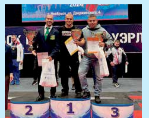
Победители на пьедестале почета! Пауэрлифтинг (от англ. power — «сила» и lift — «поднимать») — это вид спорта, заключающийся в поднятии максимально возможных тяжестей. Большинство состязаний включают в себя 3 дисциплины (словосоединение «троеборье»: приседание со штангой на плечах; жим штанги лежа на горизонтальной скамье; «тяга штанги»). Победителем соревнований признается спортсмен, поднявший наибольший вес по сумме трех упражнений

С 4 по 13 октября в Ноябрьске состоялся Кубок России по пауэрлифтингу. В соревнованиях принимали участие более 500 спортсменов из 50 регионов страны. Они состязались в четырех дисциплинах: «троеборье», «троеборье классическое», «жим», «жим классический». Иркутские завоевали шесть золотых, пять серебряных и две бронзовые медали.