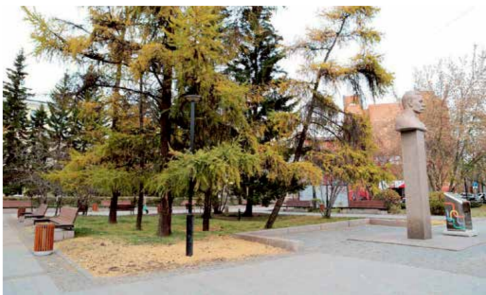
Наверное, не все горожане знают, что бюст писателя Максима Горького установлен в этом сквере в 1984 году (скульптура, кстати, изготовлена из темно-розового гранита). Раньше бетонный бюст писателя стоял на углу улиц Горького и Сух-Батара (там, где сейчас памятник Юрию Ножикову), но в 1970-х годах его разбили хулиганы

А мы напомним, что работы на объекте провели по федеральному проекту «Формирование комфортной городской среды» нацпроекта «Жилье и городская среда».